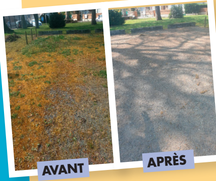
Terrain du stade remis en état lors de la matinée solidaire du 26 mars